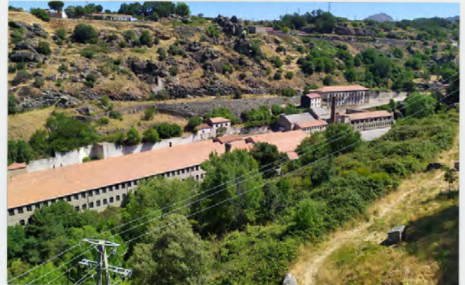
Fábrica de García y Cascón