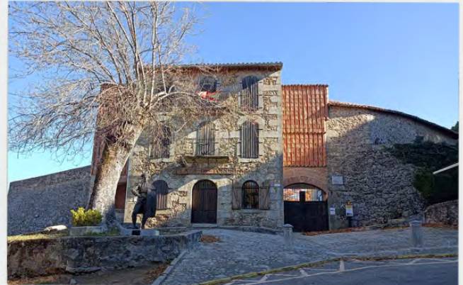
Plaza de Toros de Béjar