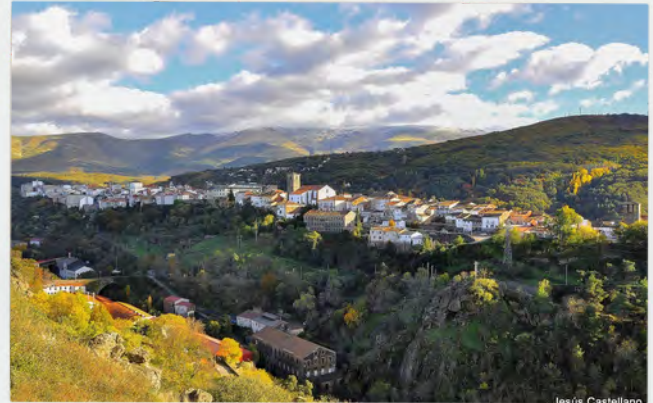
Sierra de Béjar - La Covatilla

Reserva de la Biosfera y primer Parque Micológico de Castilla y León, ofrece infinidad de alternativas para disfrutar de este entorno natural, practicando senderismo, trekking, escalada o esquí en la estación de Sierra de Béjar - La Covatilla, inaugurada en 2001, es uno de nuestros principales recursos turísticos.