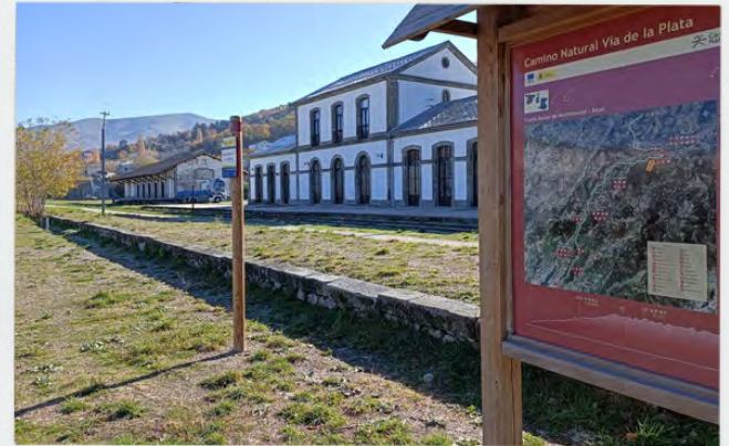
Estación del tren y Vía Verde