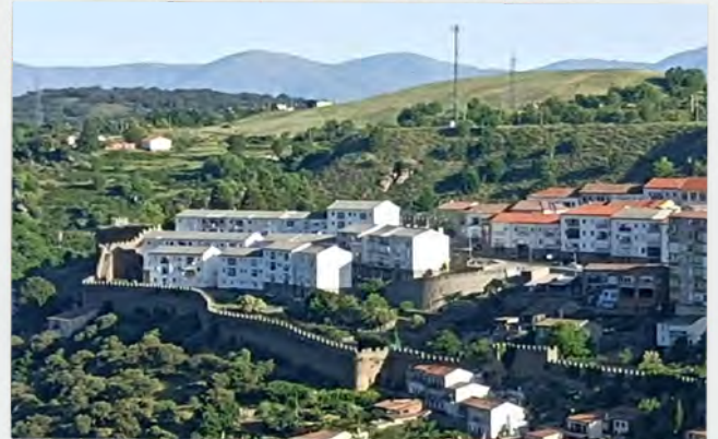
Barrio Obrero de la Antigua