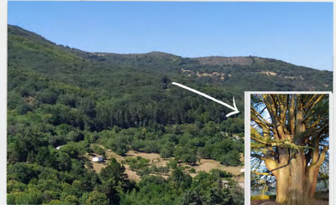
Cedro del Atlas