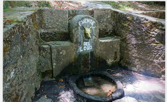
Paraje Natural Fuente del Lobo