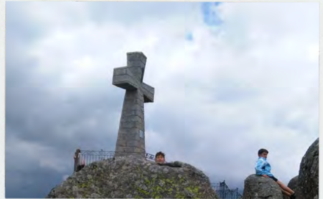
Peña de la Cruz

Desde hace siglos, se celebra una romería organizada por la Cofradía de la Santa Vera Cruz, que rememora la reconquista de la ciudad. Esta fiesta de carácter religioso tiene lugar el Martes de Pentecostés.